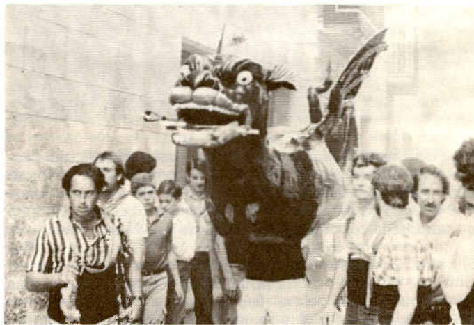
El Drac de Vilafranca del Penedès