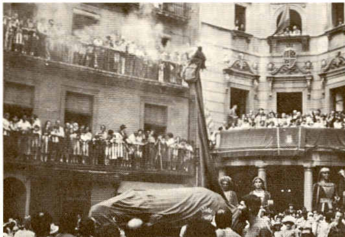
La Mula-guita de Berga