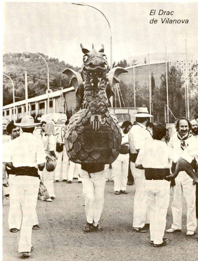
El Drac de Vilanova