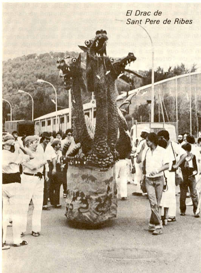
El Drac de Sant Pere de Ribes

tronc d'alzina i li donà un cop tan fort que semblava que l'estabornia. Això esverà més la fera que tornà a atacar el comte que li enfonsà la llança al cos. La fera ferida trencà la llança amb la boca i s'abraonà altra volta contra el comte. La lluita fou terrible, la fera tant l'escometia de terra com volant, i el comte a peu dret es defensava amb l'espasa fins que tornà a ferir el drac. Aquest, veient-se perdut, aixecà el vol, però el comte el va agafar d'una pota i anava donant-li estocades mentre que la fera volava, fins que anà a caure defallida al cim del Puig de la Creu, on quedà morta. El comte, en agraïment, va fer edificar una església allà dalt».