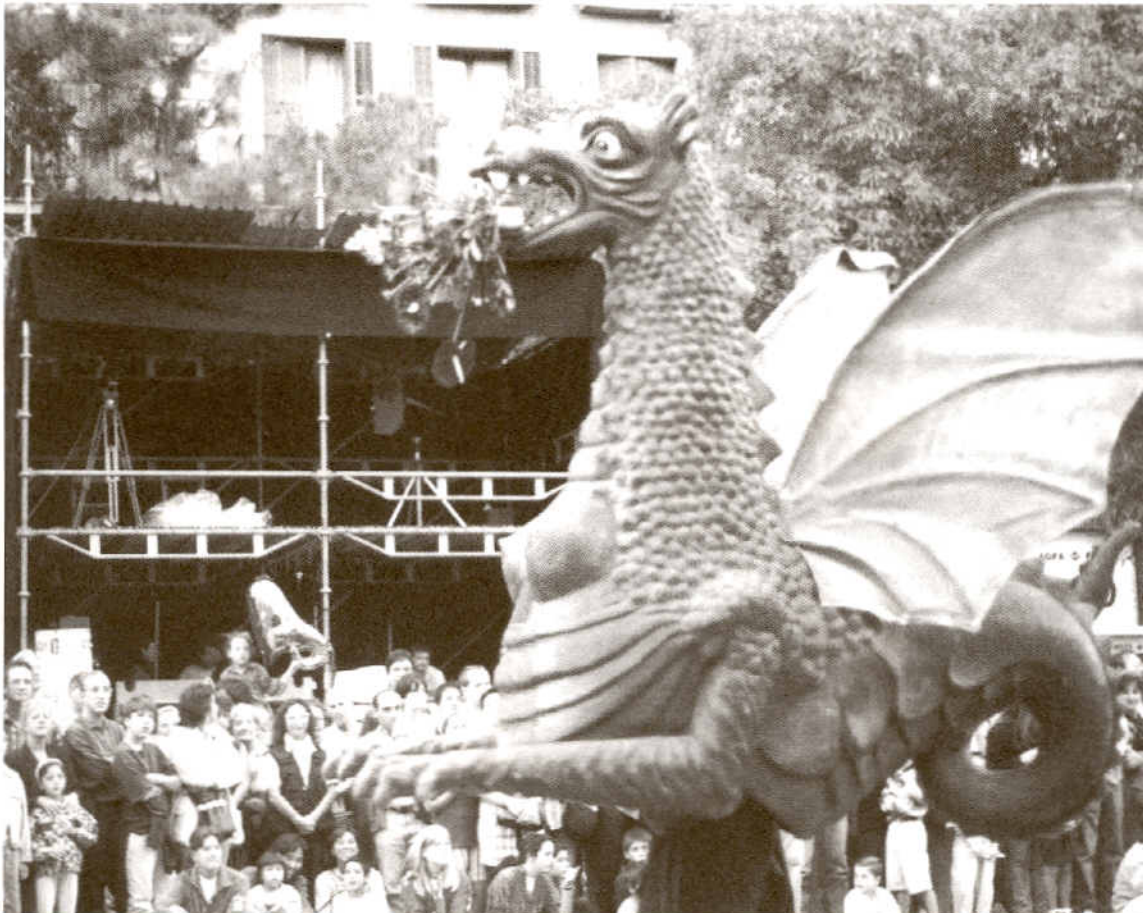
La víbria de la Barcelona Vella.