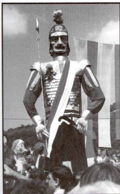
Gegants de Viana do Castelo.

Els gegants italians malgrat ser abundants estan molt poc estudiats. La poca informació que tenim la