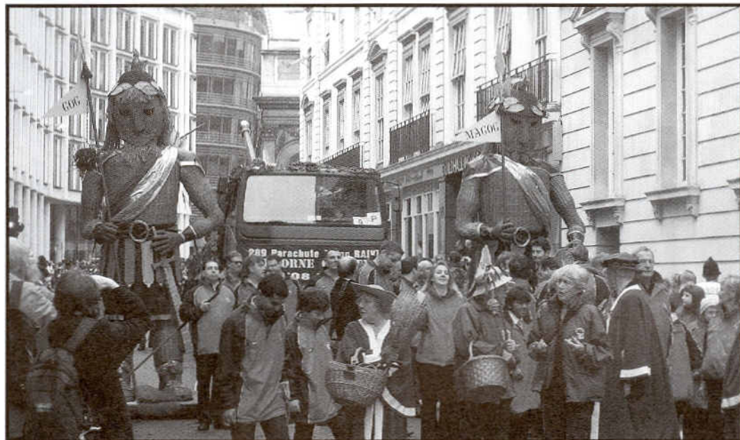
COL·LECCIÓ "O AMERIC MARTI