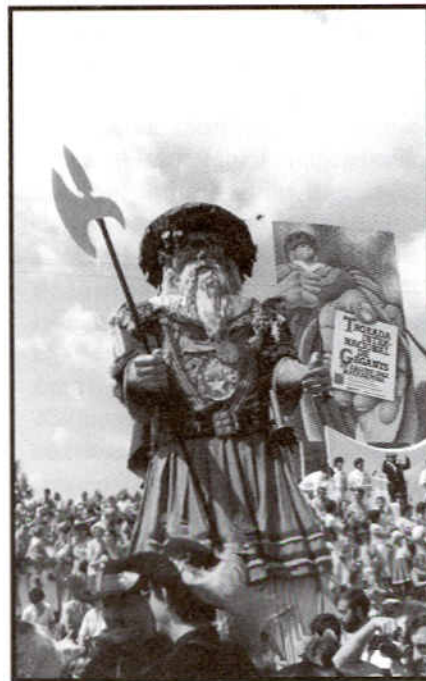
Gegant de Mariapfarr, Matadepera, 1982.