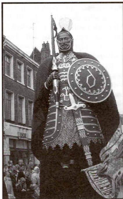
Gigantius de Maastricht, Matadepera, 1982.