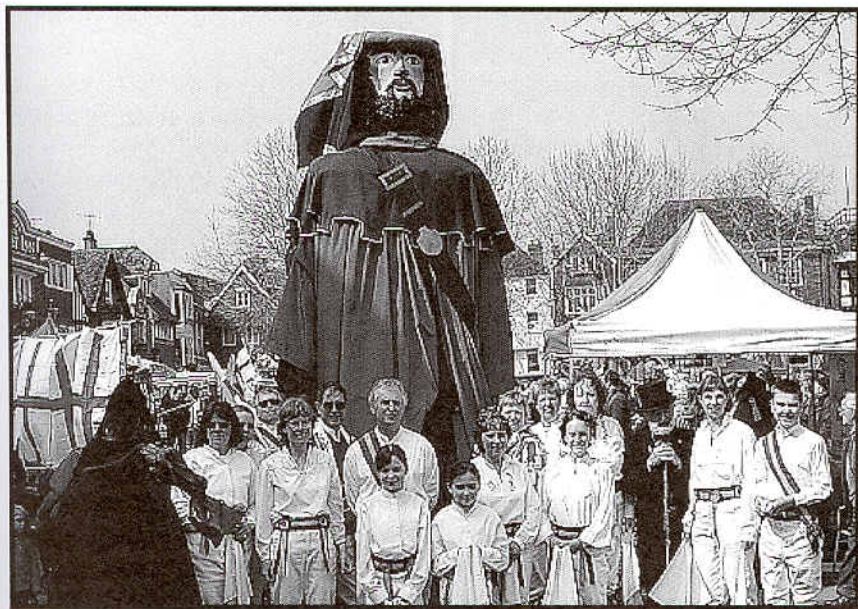
Sant Cristòfol de Salisbury actual, amb el Hob-nob a l'esquerra.

Cal destacar l' Ommegang de Termonde, és un seguici excepcional amb una carrossa amb una balena entre moltes altres representacions i amb la presència de tres gegants dels més antics de Bègica: Goliat, l' Indien i Mars. També la Lumeçon de Mons, on un drac acompanyat de diables, es baralla amb un Sant Jordi a cavall ajudats amb uns cavallets que són com gossos, anomenats chinchins . Finalment, destacaríem Ath, on a més del Cheval Bayard i tots els gegants, és l'únic lloc on queda viva la representació de la lluita de David contra Goliat, en la qual el nen ha d'aconseguir llançar a distància una piloteta i encertar el forat per on mira el geganter. Si l'encerta portarà sort a la població durant tot l'any.